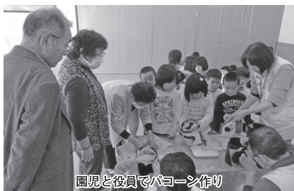
園児と役員でパコーン作り

その後、園児と一緒に給食を舌づつみ。最後は、お互いにプレゼント交換を行い、楽しい一日を過ごしました。