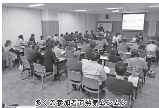
多くの参加者で熱気ムシムシ