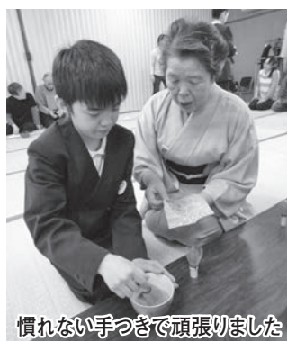
慣れない手つきで頑張りました

参加した児童は、抹茶を通じて、作法や相手への心づかいなどを学び、慣れない手つきで抹茶を立て、楽しい時間を過ごしました。