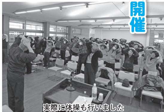
実際に体操も行いました