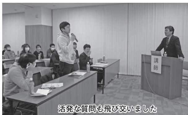
活発な質問も飛び交いました

(月)、結とぴあで、大野市災害ボランティアセンター研修会を行い、約60名の方々が参加しました。