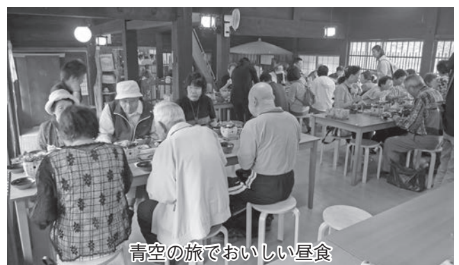
青空の旅でおいしい昼食