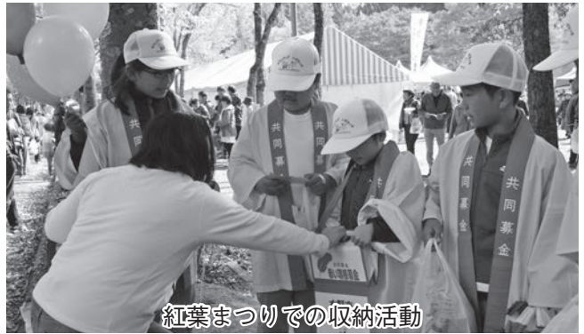
紅葉まつりでの収納活動