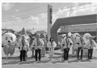
好天に恵まれました

第35回福祉ふれあいまつりが、6月3日(土)、4年ぶりに結とびあいで開催され、市民約3000人が参加しました。