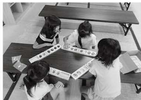
「元気なおおのっ子応援事業」