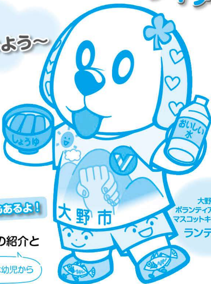
大野市 ボランティアセンター マスコットキャラクター ランティー

大野市ボランティア活動ネットワークは、市内で活動しているボランティアグループなど12団体で組織し、情報交換会や研修会など様々な活動に取り組んでいます。