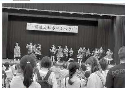
かわいい衣装でダンス