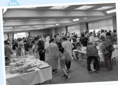
バザー会場にも多くの人が